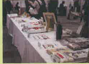
商品展示コーナーの様子

※写真は過去の開催の様子であり、レイアウト、展示等は変更となる可能性があります。