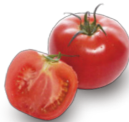
ももたろう 桃太郎

果肉のしまりがよく、熟しても割れにくい。丸みのある形で色づきがよく、甘みの中にほどよい酸味が特徴です。