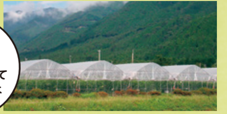
何棟も並ぶ雨除けハウス